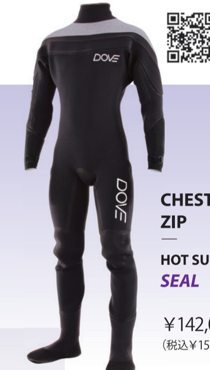
CHEST ZIP HOT SUITS SEAL