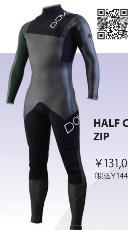
HALF CHEST ZIP