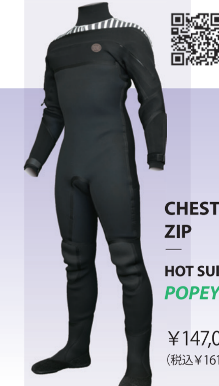
CHEST ZIP HOT SUITS POPEYE