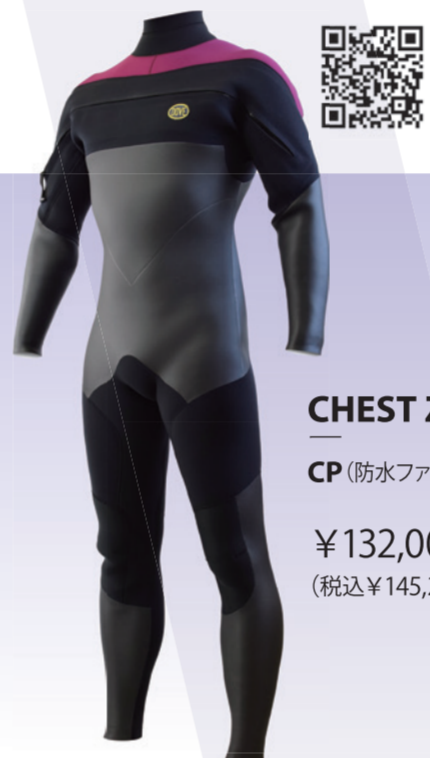
CHEST ZIP CP (防水ファスナー仕様)