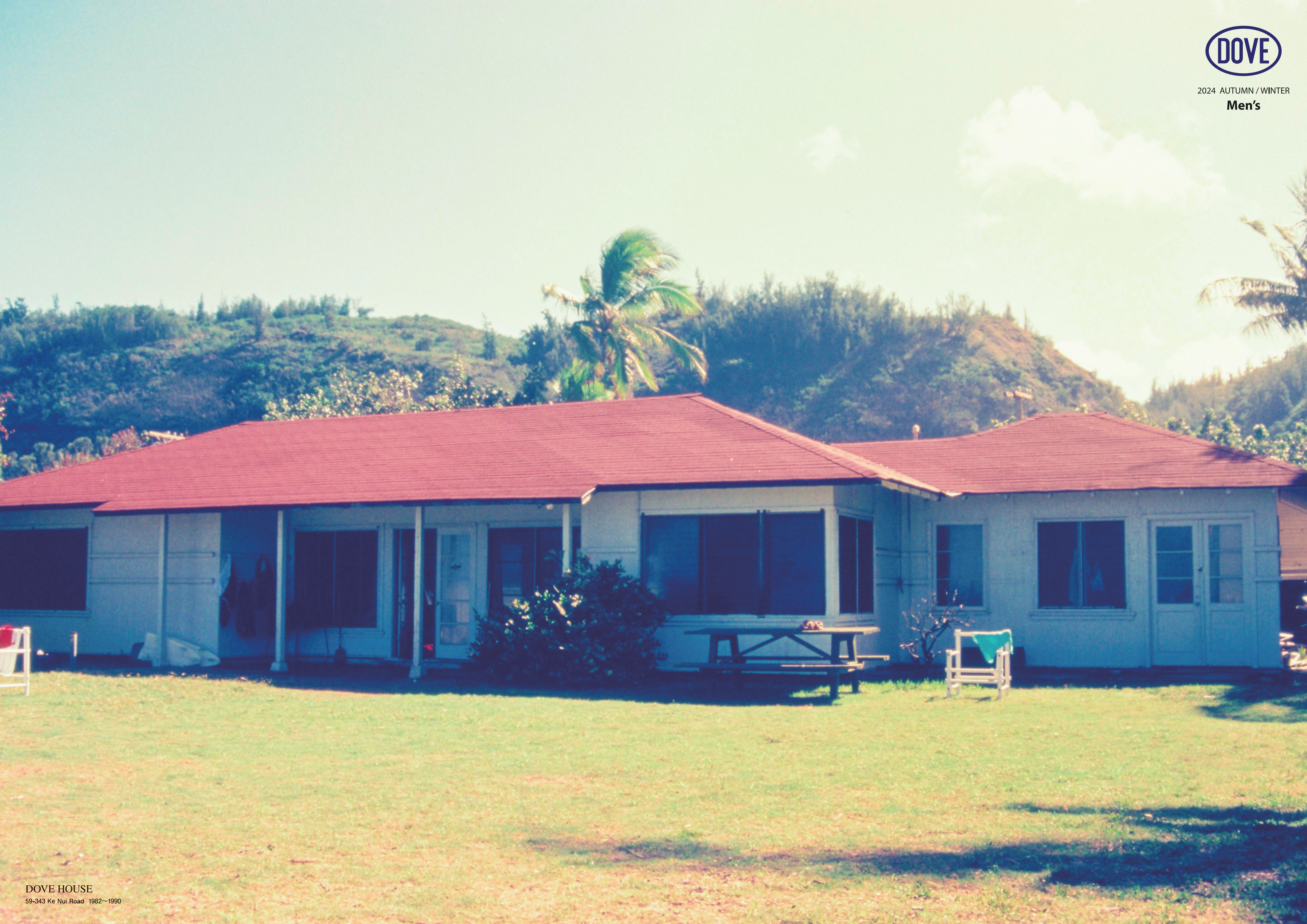
DOVE HOUSE 59-343 Ke Nui Road 1982~1990