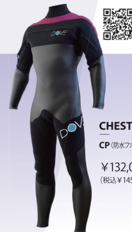
CHEST ZIP CP (防水ファスナー仕様)