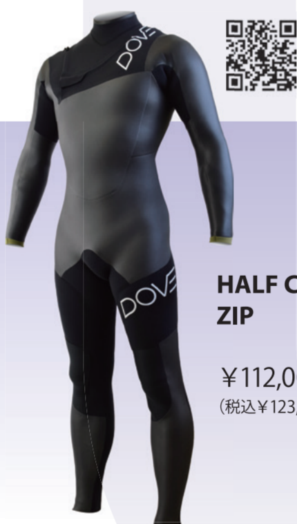
HALF CHEST ZIP