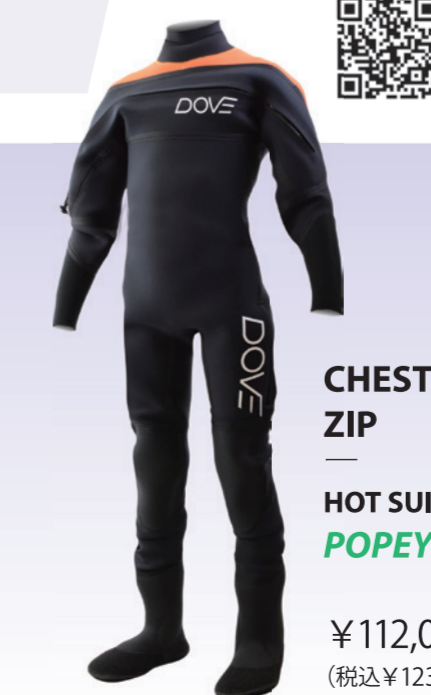
CHEST ZIP HOT SUITS POPEYE